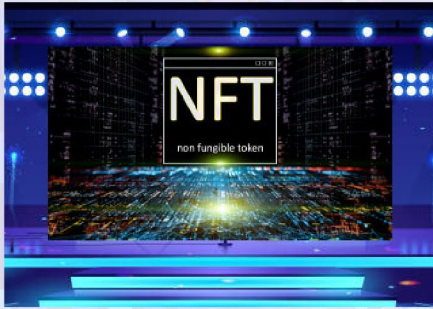
Main Stage 主舞台 30 mins (分鐘)