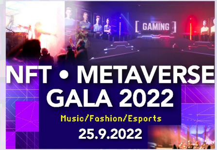
NFT • Metaverse Gala 60 mins (分鐘)