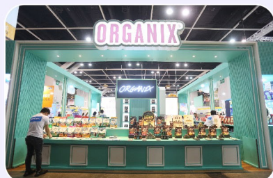
6 Booths (展位)