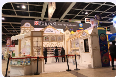
4 Booths (展位)