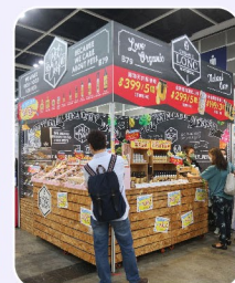
1 Booths (展位)