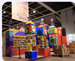
2 Booths (展位)