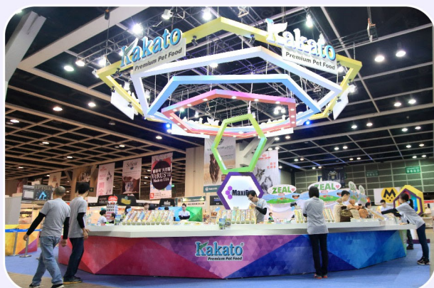
20 Booths (展位)