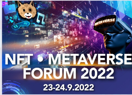
NFT • Metaverse Forum 30 mins (分鐘)