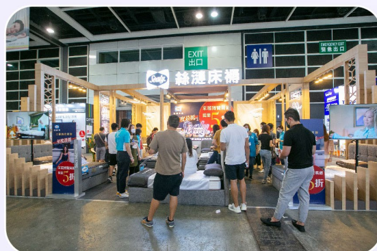
9 Booths (展位)